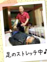
足のストレッチ中♪

リハビリテーションや日々の活動を通して 身体動作改善や筋力強化を図り 入浴する、着替える、食事をするといった 日常生活に必要な応用動作の回復の お手伝いをしています!