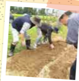
元気に育ちますように...