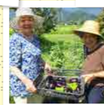
大地の恵みを収穫♪